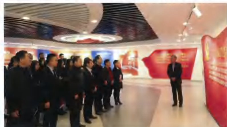
城发集团“红色1+1”导师开班