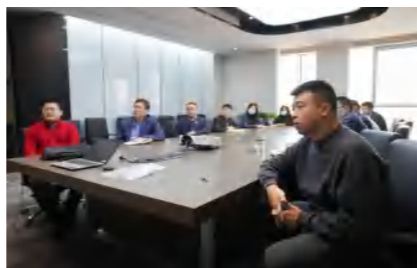
培训效果显著,素质得到提升

内容丰富、覆盖面广,既包括党性修养讲座和宏观经济分析,又涵盖金融、地产两大业务板块的行业趋势、运营管理及战略发展等各个方面。参训学员非常珍惜这次难得的学习机会,在认真听取授课的基础上,充分利用课余时间,及时整理学习笔记,认真做好训后答题,巩固消化学习内容。培训期间,还分别开展了小组讨论和集中交流,大家理论联系实际,真正把学习成果转化为指导实践工作的具体思路、方法和措施,并进行相互交流和学