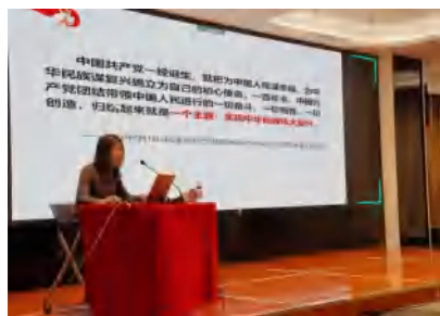
师资配备高端,视野得到开阔

2022年2月7日至11日,城发投资集团业余党校(商学院)“新春赋能”专题学习培训在城发商业中心七楼活动中心如期举行。本期培训共涵盖3个专题的授课辅导,采用“线下培训+线上直播”相结合的形式举行,线下设置1个主会场和3个分会场,线上通过腾讯会议同步直播,集团全体党员、干部、职工近500人参加培训,深入学习了党性修养、当前国际国内宏观经济走势以及金融投资、地产等多个领域的专业知识和实践经验。通过集中培训,参训学员普遍认为学到了新知识、新理念、新思路、新经验和新方法,为提升自身综合素质和能力奠定了坚实基础。