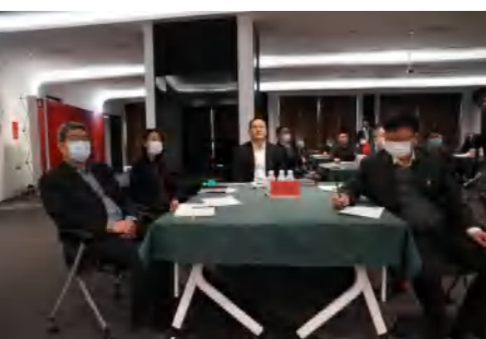
培训学员普遍感觉本次培训

内容丰富、覆盖面广,既包括党性修养讲座和宏观经济分析,又涵盖金融、地产两大业务板块的行业趋势、运营管理及战略发展等各个方面。参训学员非常珍惜这次难得的学习机会,在认真听取授课的基础上,充分利用课余时间,及时整理学习笔记,认真做好训后答题,巩固消化学习内容。培训期间,还分别开展了小组讨论和集中交流,大家理论联系实际,真正把学习成果转化为指导实践工作的具体思路、方法和措施,并进行相互交流和学