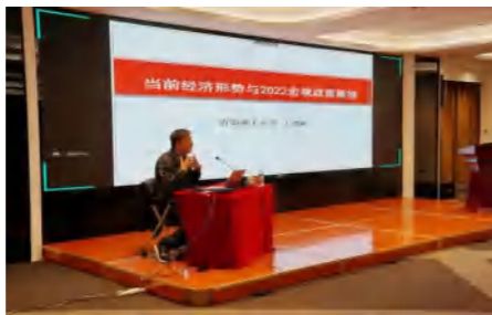
教学形式多样,学习体验深刻

本期培训,实行传统培训方式和创新教学模式相结合,采取了专题辅导、案例教学、经验分享、互动交流等多种形式。