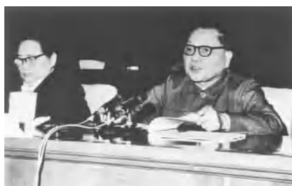
邓小平在理论务虚会上作题为《坚持四项基本原则》的讲话

中国共产党在社会主义初级阶段的基本路线,亦称“中国共产党建设有中国特色的社会主义的基本路线”。从 1987 年 10 月中共第十三次全国代表大会开始,在邓小平建设中国特色社会主义理论指导下逐步形成:“领导和团结全国各族人民,以经济建设为中心,坚持四项基本原则,坚持改革开放,自力更生,艰苦创业,为把我国建设成为富强、民主、文明、和谐、美丽的社会主义现代化强国而奋斗。”“一个中心、两个基本点”是这条路线的简明概括。由新时期的总任务、总路线发展而来。一个中心,即以经济建设为中心;两个基本点,即四项基本原则和改革开放。