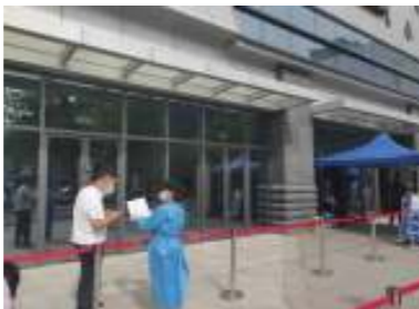
彰显责任担当,立足岗位建功

物业团支部大力弘扬工匠精神,组织青年职工积极参与技能比武、知识竞赛、金牌管家、学雷锋等主题活动,多次