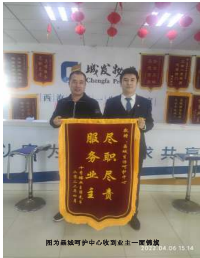
图为晶城呵护中心收到业主一面锦旗