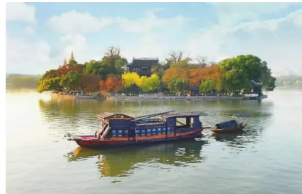
红船——中共一大纪念船