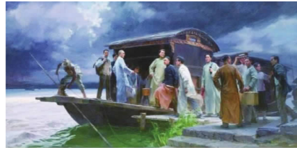
代表们在嘉兴南湖的游船上

共有 13 位。分别是:上海小组的李达、李汉俊;武汉小组的董必武、陈潭秋;长沙小组的毛泽东、何叔衡;济南小组的王尽美、邓恩铭;北京小组的张国焘、刘仁静;广州小组的陈公博;旅日小组的周佛海以及陈独秀委派的包惠僧。