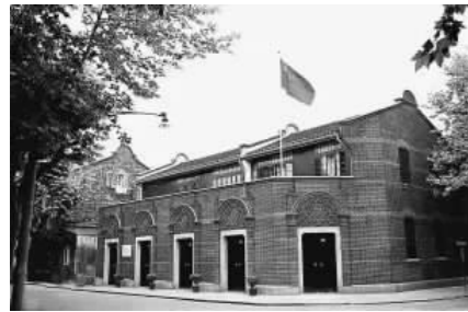
上海法租界望志路 106 号(现兴业路 76 号)

中国共产党第一次全国代表大会于 1921 年 7 月 23 日晚上举行。党的一大确定党的名称为“中国共产党”,决定设立中央局作为中央的临时领导机构,选举产生了以陈独秀为书记的中央局。党的一大宣告中国共产党正式成立。中国共产党的创建,是中华民族发展史上开天辟地的大事变。。最后一天的会议转移到浙江嘉兴南湖举行。