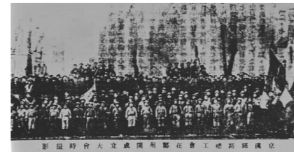
图为京汉铁路总工会召开成立大会时全体代表合影

党成立后致力于组织领导工人运动,以 1922 年 1 月香港海员罢工为起点,1923 年 2 月京汉铁路工人罢工为终点,掀起了中国工人运动第一次高潮。在持续的 13 个月里,全国发生大小罢工 100 余次,参加人数在 30 万以上。党领导发动和组织的工农运动尤其是工人运动,显示出中国工人阶级坚定的革命性和坚强的战斗力,扩大了中国共产党在全国的政治影响,掀起全国规模的大革命准备了一定条件。